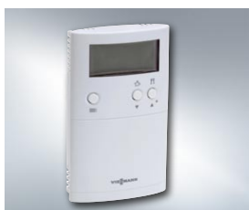
Termostat pomieszczenia Vitotrol 100 typ UTDB to komfortowe sterowanie ogrzewaniem i dodatkowe oszczędności.