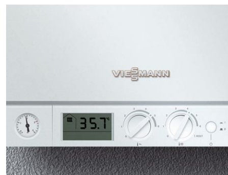
Wyjątkowo łatwa obsługa regulatora kotła - dwa pokrętła umożliwiają szybkie nastawianie temperatury wody grzewczej i wody użytkowej.

Kocioł Vitopend 100-W jest szczególnie łatwy w obsłudze i konserwacji. Wszystkie istotne dla prac konserwacyjnych elementy są łatwo dostępne od przodu kotła.